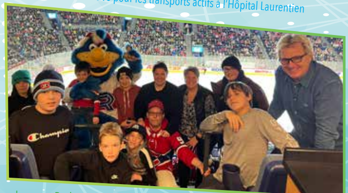
Loge aux Rockets avec les jeunes de la Pédiatrie sociale Coeur des Laurentides