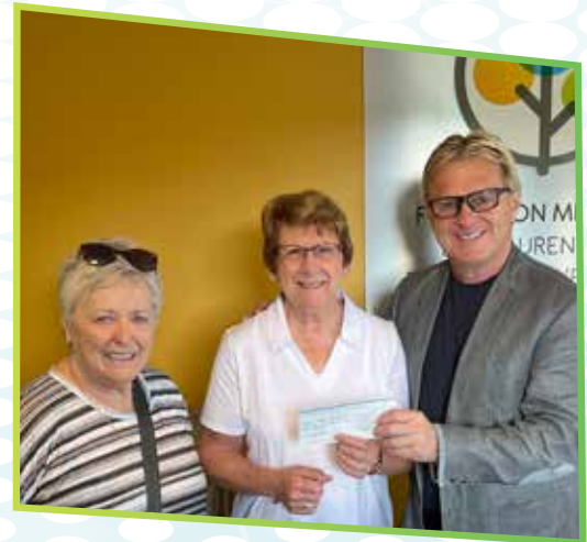
Levée de fonds de résidents de Vendé