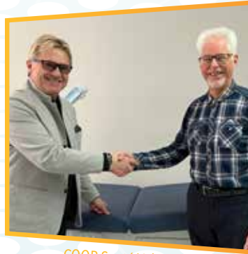
COOP Santé Val-Morin