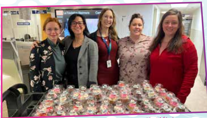
Petites douceurs pour les employés de l'hôpital le 14 février