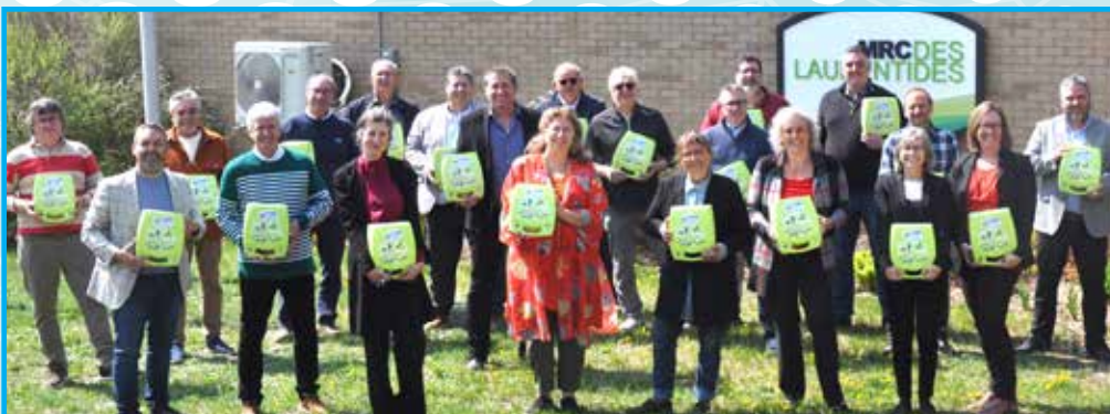
Maires de la MRC des Laurentides et le maire de St-Donat.