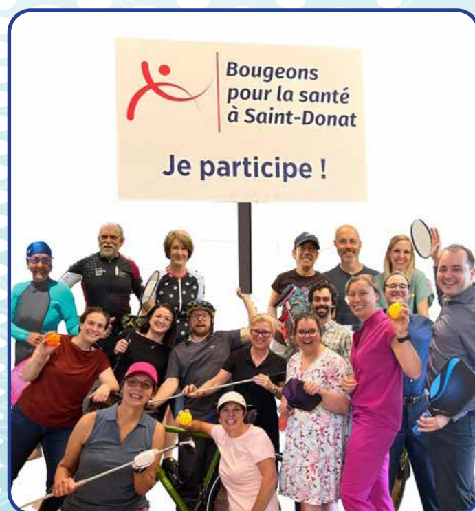
Quelques participants et membres du comité organisateur de Bougeons 2023