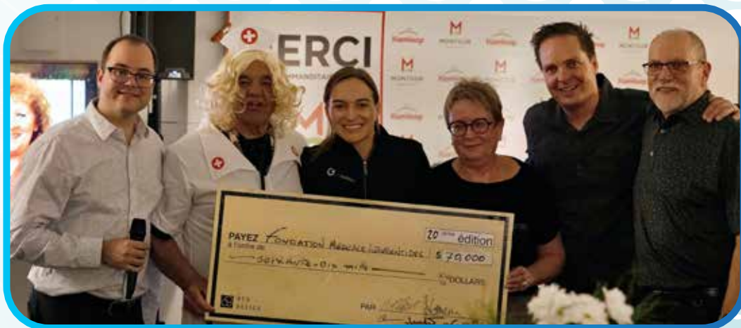
Les organisateurs du tournoi Lauda Garceau 2023