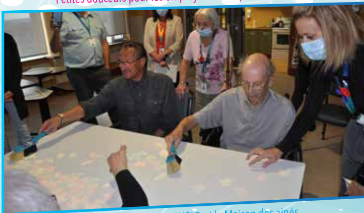
Console de jeu pour les CHSLD et la Maison des aînés.