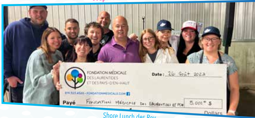
Shore Lunch des Roy