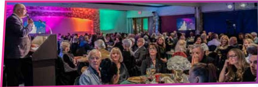
Souper de la Fondation 2023