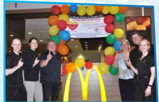
Grand McDon 2023