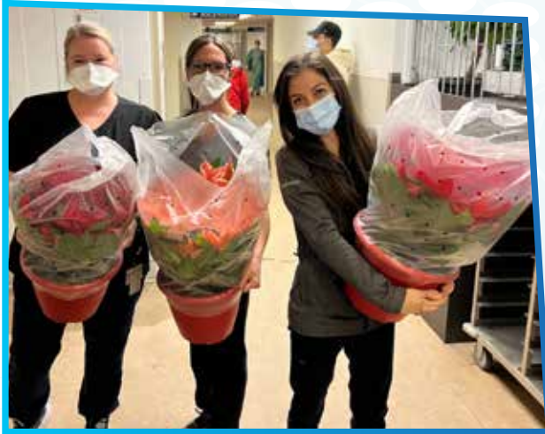
Poinsettias pour les résidents et employés des CHSLD et de l'Hôpital Laurentien