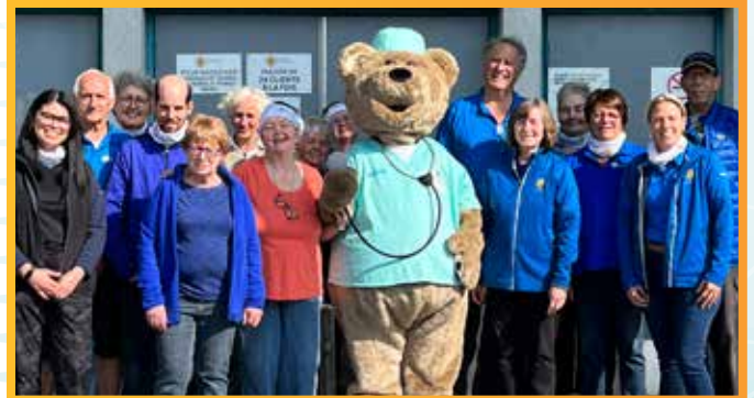
Une partie l'équipe des Trésors de la Fondation

Les meubles ont leur section spéciale au sous-sol. « Aux Trésors de la Fondation, nous allons chercher les meubles