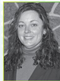
MAUDE ROUSSEAU HOPITAL LAURENTIEN