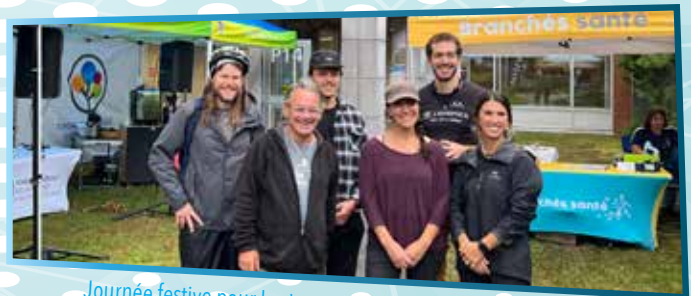
Journée festive pour les transports actifs à l'Hôpital Laurentien