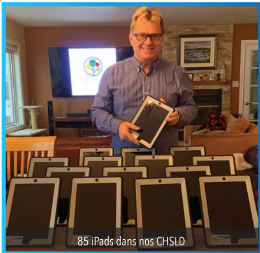
85 iPads dans nos CHSLD