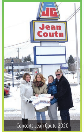
Concerts Jean Coutu 2020