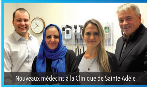
Nouveaux médecins à la Clinique de Sainte-Adèle