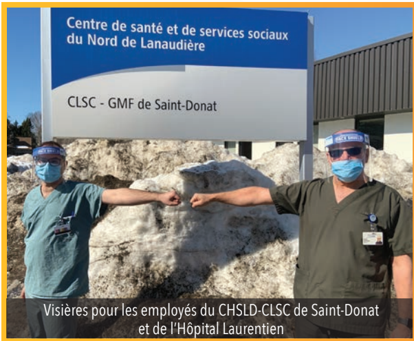
Visières pour les employés du CHSLD-CLSC de Saint-Donat et de l'Hôpital Laurentien