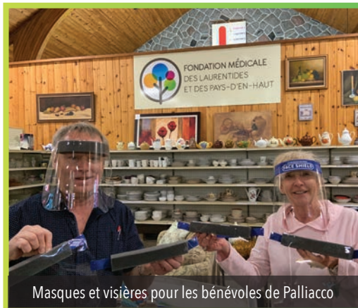
Masques et visières pour les bénévoles de Palliaccio