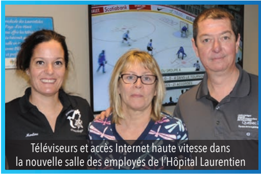
Téléviseurs et accès Internet haute vitesse dans la nouvelle salle des employés de l'Hôpital Laurentien