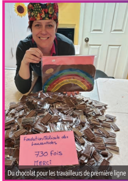
Du chocolat pour les travailleurs de première ligne