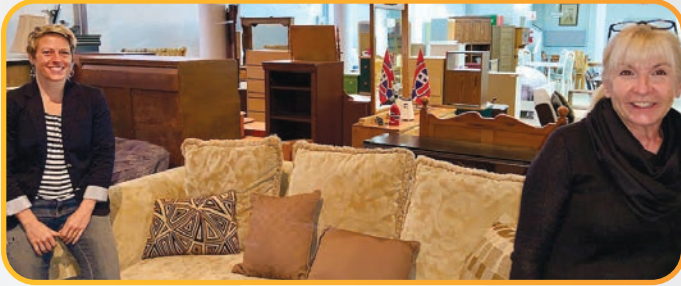
Caroline et Odette sont photographiées dans le nouvel Espace Meubles des Trésors, une nouveauté majeure pour la Fondation qui génère déjà des retombées fort positives.