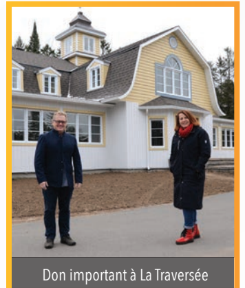
Don important à La Traversée