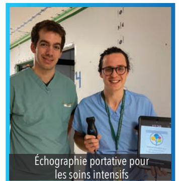
Échographie portable pour les soins intensifs